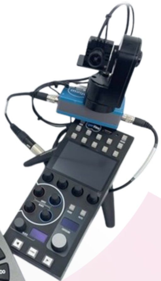
Pupitre de commande Panneau de commande CyanView